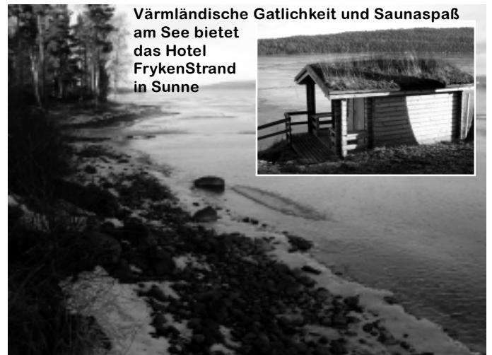
Värmländische Gätlichkeit und Saunaspaß am See bietet das Hotel FrykenStrand in Sunne