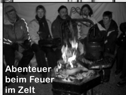
Abenteuer beim Feuer im Zelt