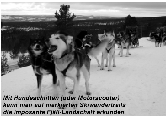
Mit Hundeschlitten (oder Motorscooter) kann man auf markierten Skiwandertrails die imposante Fjäll-Landschaft erkunden

Skispaß in allen 4 Himmelsrichtungen, 38 Abfahrten für Anfänger und Köhner