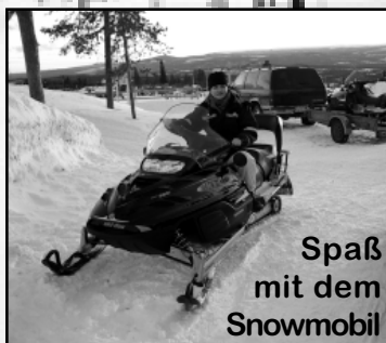
Spaß mit dem Snowmobil