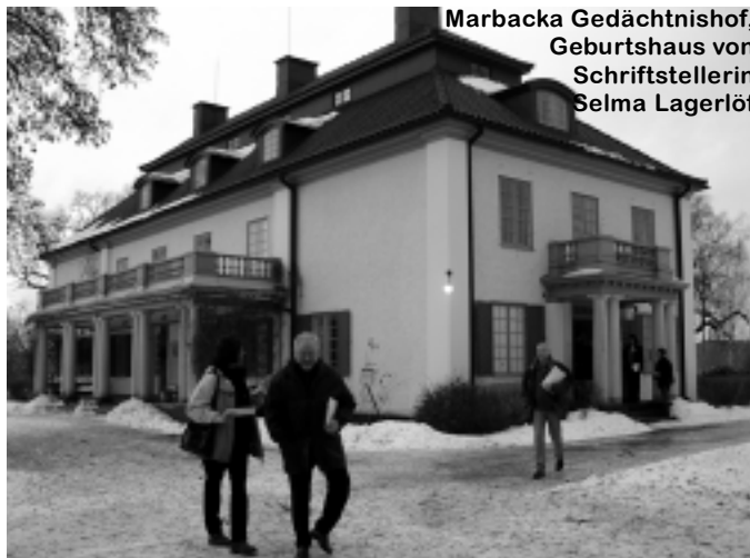
Marbacka Gedächtnishof, Geburtshaus von Schriftstellerin Selma Lagerlöf