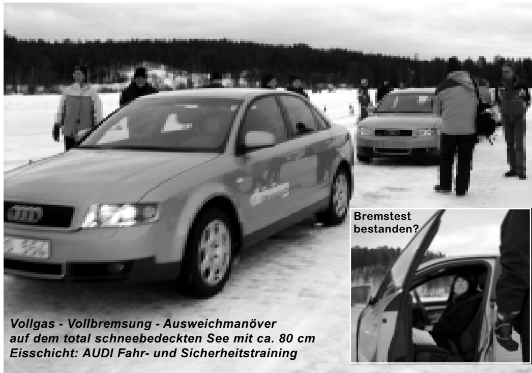
Vollgas - Vollbremsung - Ausweichmanöver auf dem total schneebedeckten See mit ca. 80 cm Eisschicht: AUDI Fahr- und Sicherheitstraining

...für die Hungrigen bietet Idre Fjäll am Abend. Im Restaurant "Farfars Hörna" ist die Einrichtung urgemütlich und das Essen erstklassig, mit Wild und anderen lokalen Spezialitäten. Die Anreise erfolgt grundsätzlich mit dem eigenen Pkw zunächst bis Kiel, von dort mit einer der modernen Stena Line-Fähren über Nacht nach Göteborg und anschließend weiter zum Zielort. Bis Idre Fjäll sind es von Göteborg ca. 580 Kilometer. Wichtig: Winterreifen sind in Schweden Pflicht, das Mitführen von Schneeketten ist empfehlenswert. Auf halber Strecke in SUNNE bietet sich ein Aufenthalt im Hotel FrykenStrand oder in Selma Lagerlöfs Wohnsitz mit Besichtigung an. Stena Line bietet auch Gruppenreisen mit Schiff und Bus an. Eine Woche Winterurlaub mit Stena Line kostet für vier Personen in Idre Fjäll ab 232,- Euro. Die Broschüre "Weiße Ferien 2002/2003", weitere Informationen sowie die Möglichkeit zur Buchung gibt es im Reisebüro oder direkt bei Stena Line, Tel. (04 31) 90 99, Internet www.stenaline.de